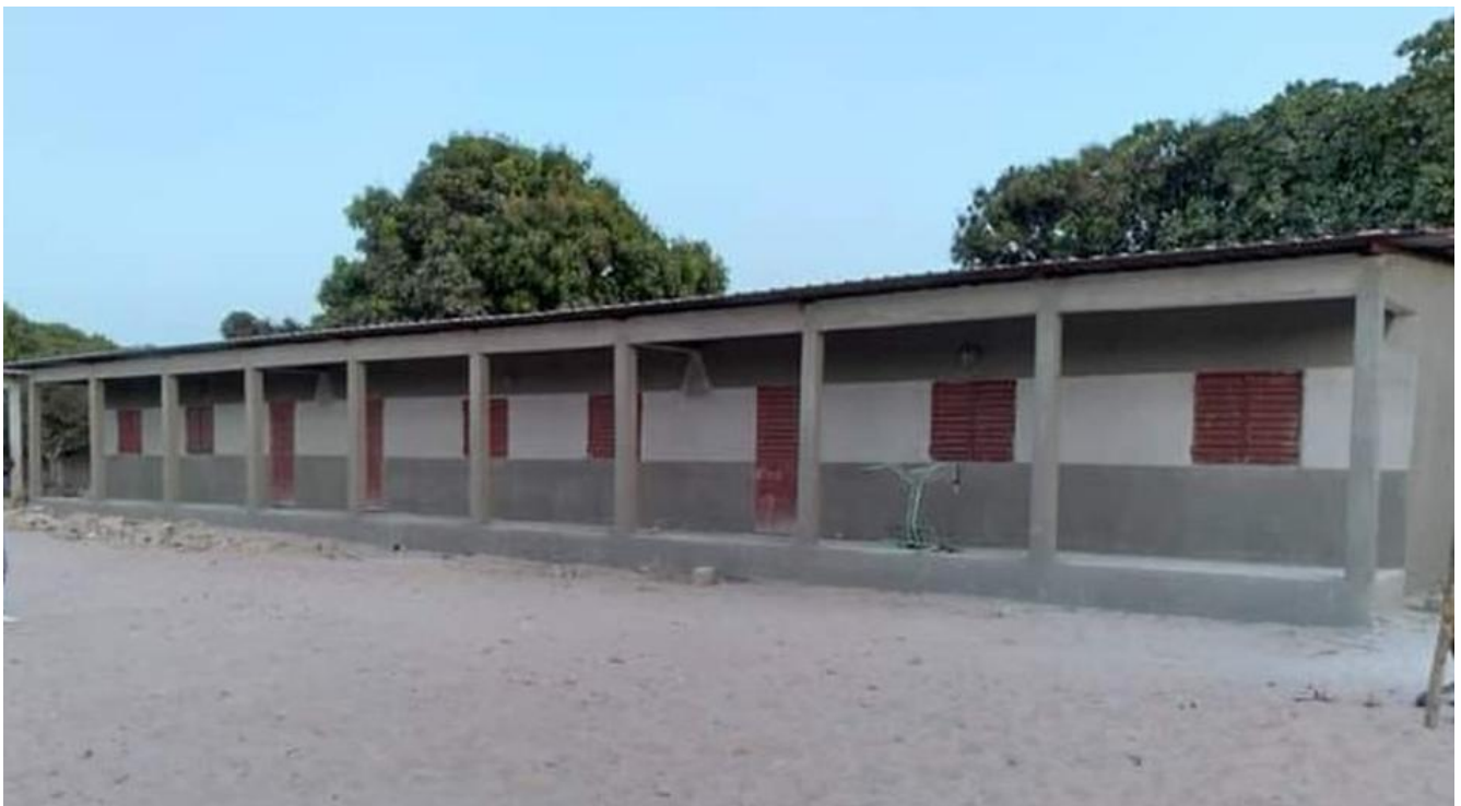
Tot slot nogmaals een totaalbeeld van de drie klaslokalen, de in de 3e fase werden gebouwd.

Het bestuur van Stichting Bright Future for Children wenst u een plezierige kerst en een positief en gezond 2023!