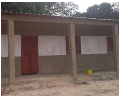
De laatste 3e klaslokalen zijn met flinke vertraging eindelijk klaar.